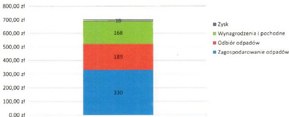
Wykres 3. Struktura kosztów odbioru i zagospodarowania 1 Mg odpadów (zł) (dane uzyskane od Wykonawcy)