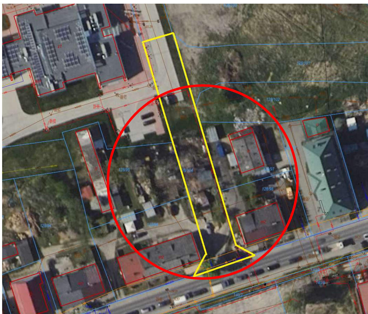
Rys nr.1 Lokalizacja działki nr 128/104 przy Ośrodku Zdrowia

Pragnę również nadmienić, że działka 128/104 stanowiąca mienie publiczne, nie jest aktualnie wykorzystywana (w części znajdującej się przy ulicy Sadowej) przez wszystkich podatników Gminy Łysomice. Charakter tej sytuacji może sugerować brak racjonalnej gospodarności władz Gminy Łysomice. Status quo tej strategicznie położonej działki musi w tym miejscu zostać zmieniony, a działka w pełni wykorzystana przez osoby starsze, osoby niepełnosprawne, rodziców z dziećmi i wszystkich mieszkańców.