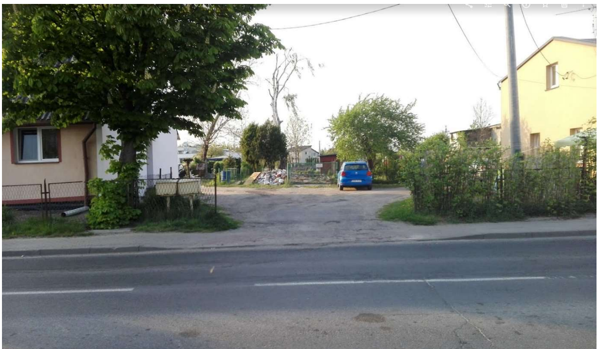
Zdjęcie nr.2 Widok na działkę 128/104 od strony ul. Sadowej