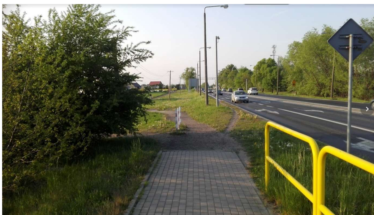
Zdjęcie nr.1 Koniec chodnika przy głównym skrzyżowaniu w Łysomicach / ul.Gdańska/ul.Warszawska - zdjęcie w kierunku północnym (w stronę Pomorskiej Strefy Ekonomicznej).