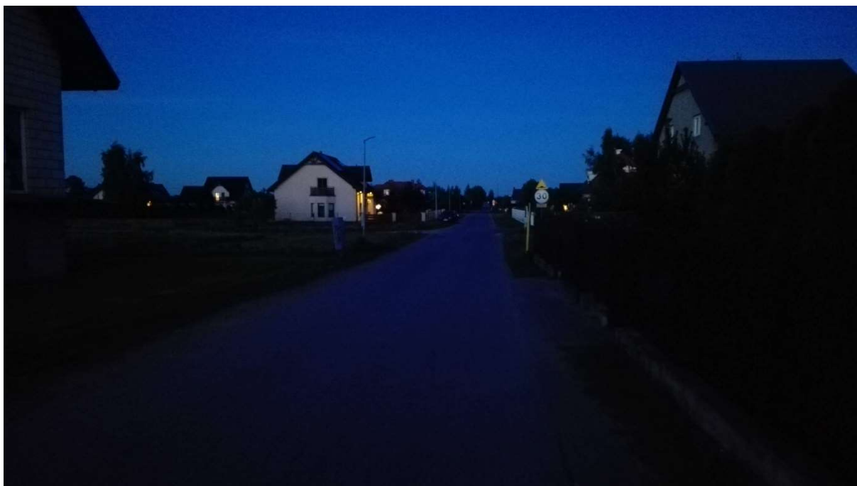
Zdjęcie nr.1 Niedziałające latarnie uliczne na ul. Długiej / 18.05.2022 g. 21:40