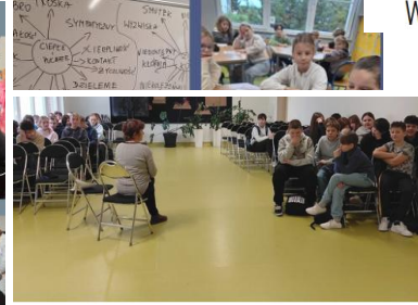
Spotkanie z psychologiem