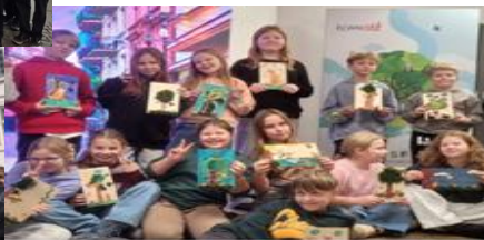
Wyjazd klas III-IV do ECWM w Toruniu