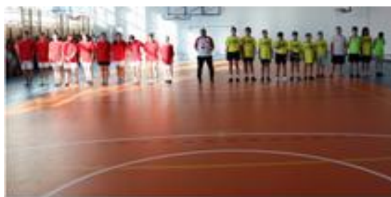
Mecz „Klasa VIII kontra reszta świata”