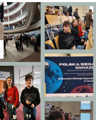
„Zaelektryzowani” w naszej szkole