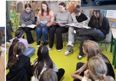
Wspólne czytanie z Wolontariatem