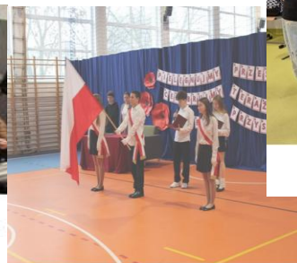
Akademia z okazji Narodowego Święta Niepodległości