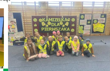
„Kamizelka dla pierwszaka”