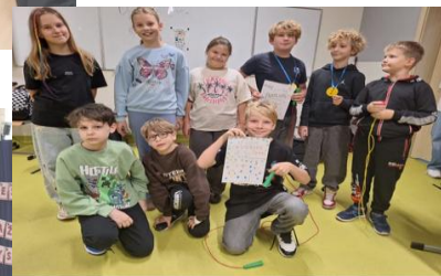
Dzień Chtopaka w klasie IV