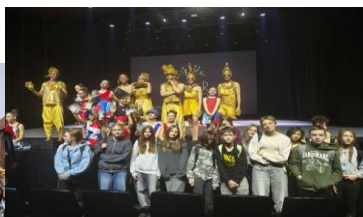
Klasa VII na musicalu Kosmos w CKK Jordanki