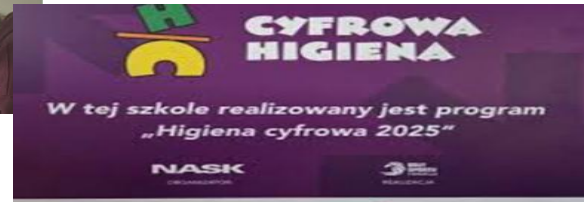
W tej szkole realizowany jest program „Higiena cyfrowa 2025”