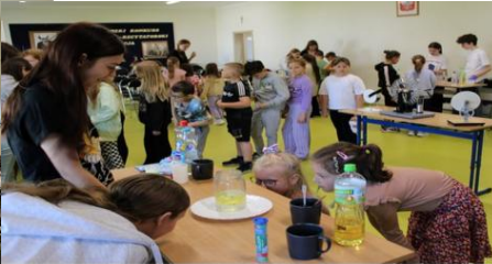
Dzień Nauk Przyrodniczych w naszej szkole