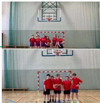
MISTRZYNI GMINY ŁYSOMICE W KOSZYKÓWCE