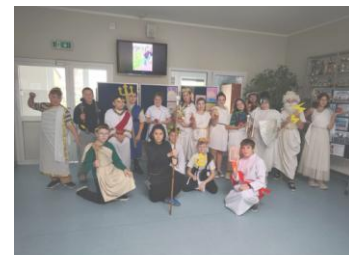
„Bogowie z Olimpu” – projekt w klasie V