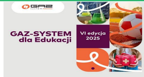
Nasza szkoła bierze udział w programie „GAZ-SYSTEM dla Edukacji”