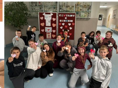
Dzień Głośnego Czytania i V edycja akcji „Czytamy z Sercem”