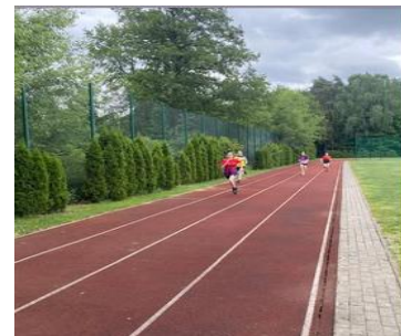
INDYWIDUALNE MISTRZOSTWA POWIATU TORUŃSKIEGO W LEKKOATLETYCE