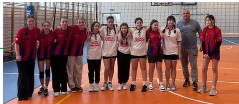
MISTRZYNI GMINY ŁYSOMICE W MINI SIATKÓWCE