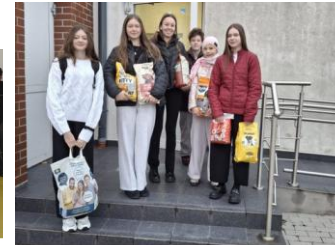
Podsumowanie zbiórki karmy dla zwierząt