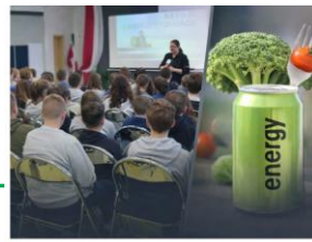
Spotkanie profilaktyczno-edukacyjne z przedstawicielem Sanepidu