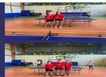
MISTRZYNI GMINNYCH MISTRZOSTW W TENISIE STOŁOWYM