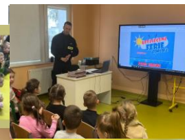
Bezpieczne ferie zimowe – spotkanie ze strażakami