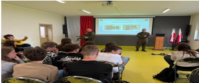
Spotkanie z żołnierzami Wojska Polskiego