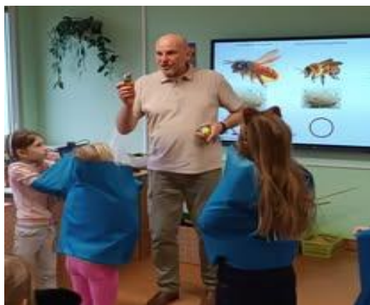
Projekt UM „Zielone znam o zielone” dbam”