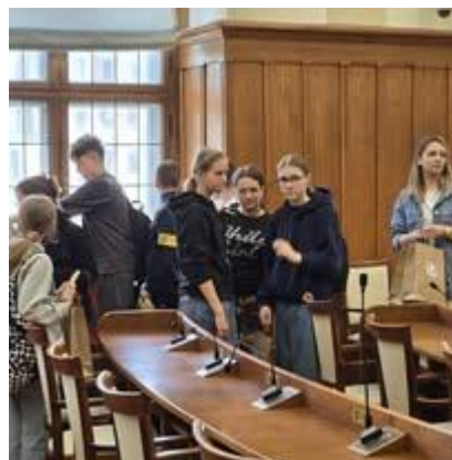
Bierzemy udział w ciekawych wydarzeniach – symulacja rozprawy sądowej. Zapraszamy do szkoły znanych sportowców.