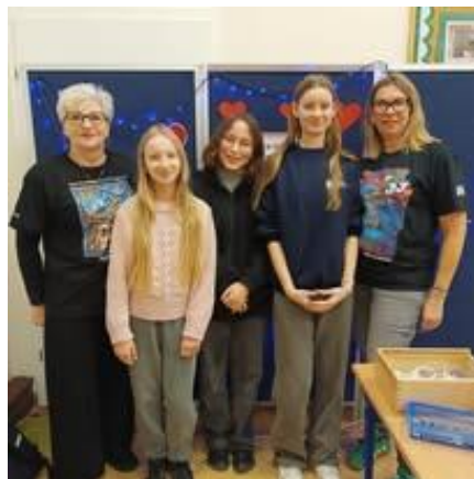
Włączamy się w akcje WOŚP i „Szlachetna paczka”