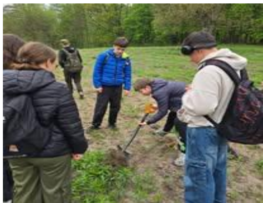
Dbamy o środowisko – sadzimy drzewka – Leśnictwo Olek