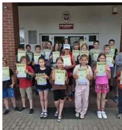
Ogólnopolski Konkurs Przyrodniczy Świetlik – laureat III miejsca