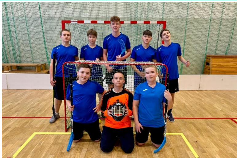
Mistrzowie Gminy w unihokeja