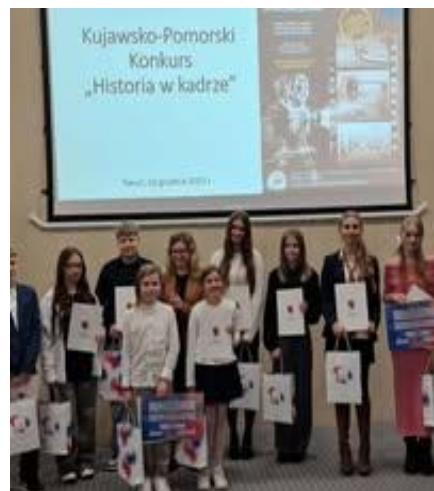
II m. w Wojew. Konkursie „Historia w kadrze”